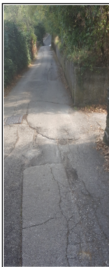
Foto del manto stradale.