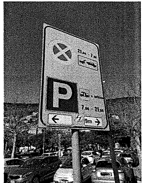
Cartello stradale area sosta camper