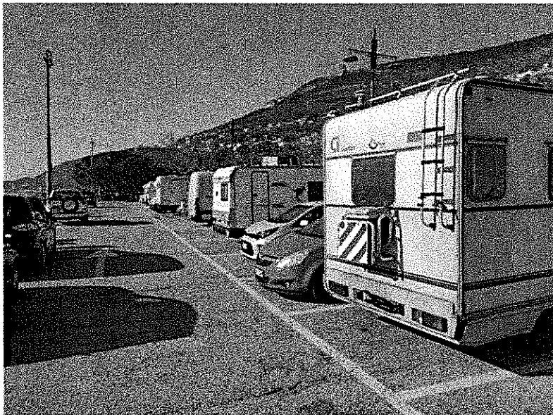
Camper in sosta stanziale