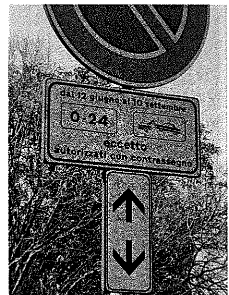
Cartello stradale nel parcheggio riservato ai residenti